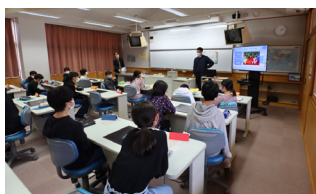
[ 英語科の授業 ]