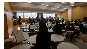
[ 部活動見学 ]