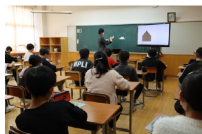
[ 数学科の授業 ]