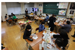
[ 美術科の授業 ]