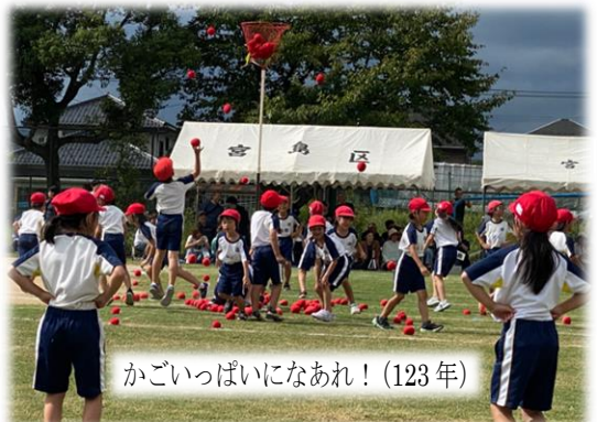
かごいっぱいになあれ! (123年)