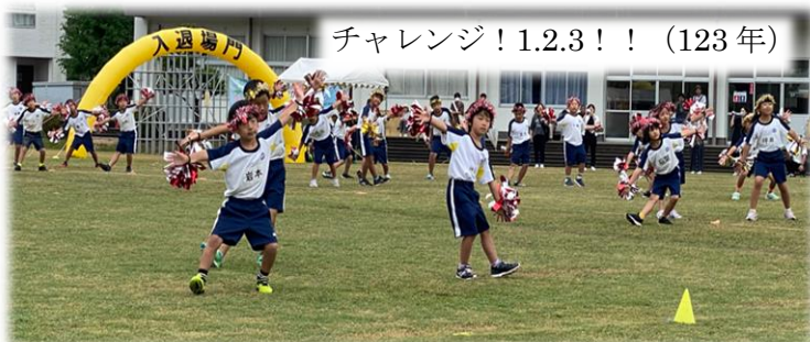
チャレンジ! 1.2.3!! (123年)