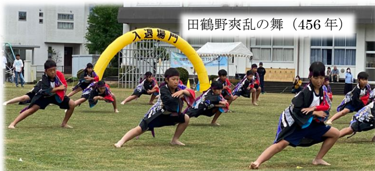
田鶴野爽乱の舞 (456年)

また、PTA役員の皆様方には、テントの準備や片付け等お手伝いいただき、順調に終わることができました。皆様方の後押しにより、会場全体が一丸となって、子ども達一人一人の躍動につながる150周年の記念すべき良い運動会を創っていただきました。ありがとうございました。