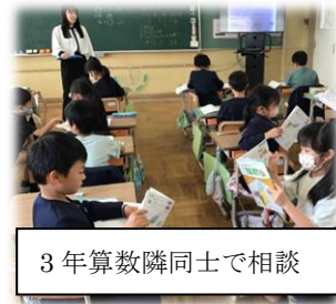
3年算数隣同士で相談