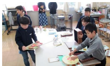
なかよし学級 なかよしレストラン