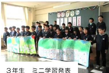
3年生 ミニ学習発表