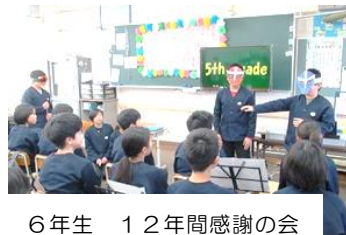
6年生 12年間感謝の会

約150名の保護者・地域の皆様にご来校いただき、通常の授業や各学年の工夫を凝らした発表などを見ていただきました。緊張していた子もいましたが、みんな一生懸命、学習や活動をしていたように感じました。ご家庭でいっぱい褒めていただけたでしょうか。参観日は褒めるチャンスです。