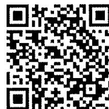
動画サイトQRコード

※ 携帯の場合は、QRコードを読み取ったサイトの一番下にある 「体育保健課学校体育班映像サイト」をクリックしてください。