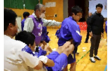
傷病者の運搬 地域の方と...