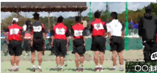
↑ 試合前…凛々しい後ろ姿!