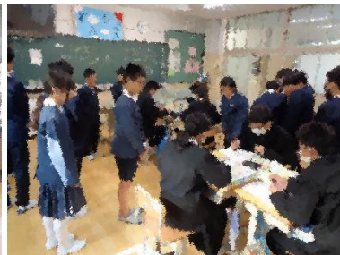
社会ではグループに入り意見を言う場面もありました。