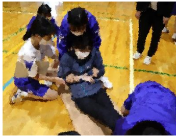
中学生なら一人前の救助員です!