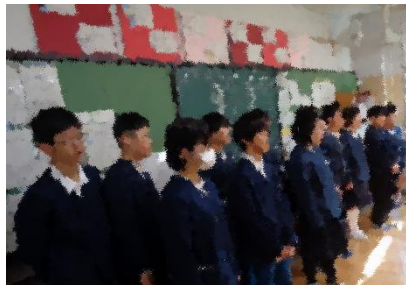
最初は緊張の面持ちでしたが...

港小学校 6 年生が中学校生活を体験する、小中一貫教育の取組の一つです。授業、給食、清掃、部活動と体験や見学の中で中学生や先生と交流をしました。その中で、人の話を聞く姿勢や一つ一つの一生懸命さ...港の子どもたちの素晴らしい共通点を垣間見ました!