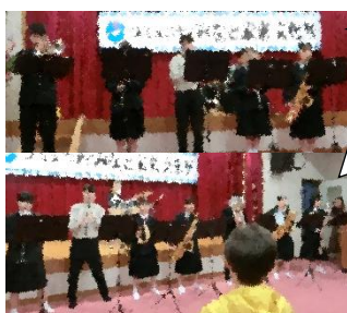
吹奏楽部と顧問の先生で!