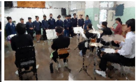
最後は部活動見学(吹奏楽部) 来年の 4 月待ってます!