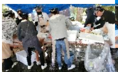
長蛇の列に大忙し! 完売ありがとうございました!