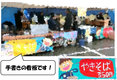
手書きの看板です!