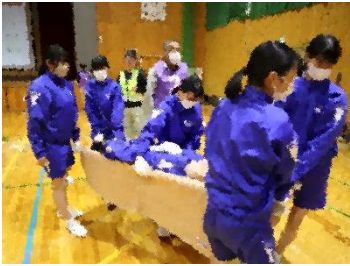
毛布の担架(とても強い!)で運搬