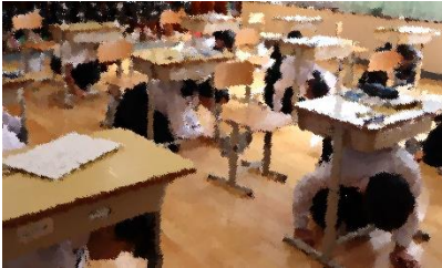
休憩時間にいきなりベルが鳴りました!

台風 23 号メモリアルデーでもある 10 月 20 日(金)に避難訓練と、地域の方々にもお越しいただいた防災授業を行いました。