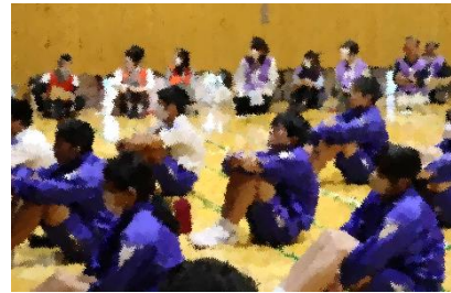
地域の皆様 ありがとうございました!