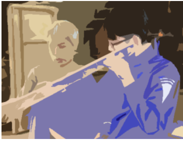
アウゲ 椅子の背もたれの曲 線を削っています。←