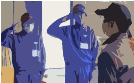
豊岡消防城崎分署 人命に関わる仕事の厳しさを感じました。←