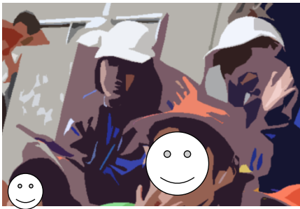
港子ども園 →つるつる坊主を作っています ←アシカショーと一緒に