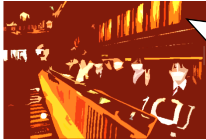
脇の二階席でしたが、生のオーケストラによる名曲の響き、迫力ある指揮者の動きとそれに応える演奏家たち…圧巻の一時間でした!