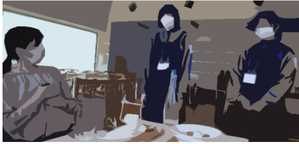
Sea Zoo 商品の陳列…細かな心遣いが実はとても大切です。↓ Terrace 寺川先生の注文したプレートランチ「お待たせしました!」←