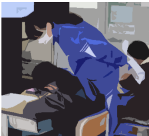
港小学校 算数の授業で個人指導。←