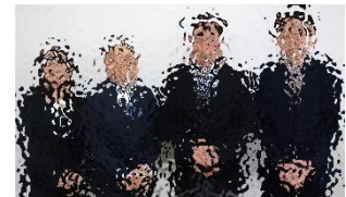
本部役員の皆様です!

先日のPTA総会を経て、こちらの方々に決定いたしました。今年度から、役職を兼務し、全体で10名の役員数となります。コロナ禍を経て、新たにスタートいたします。保護者の皆様方のご支援・ご協力をよろしくお願いいたします!