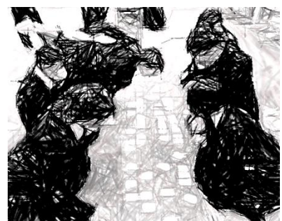
2年生:取りに行ったらけれど、間違いに気づいた瞬間?