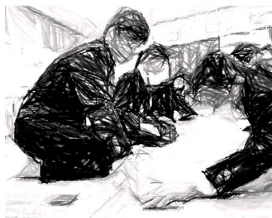
3年生:Oさんの方が早かった決定的瞬間です!