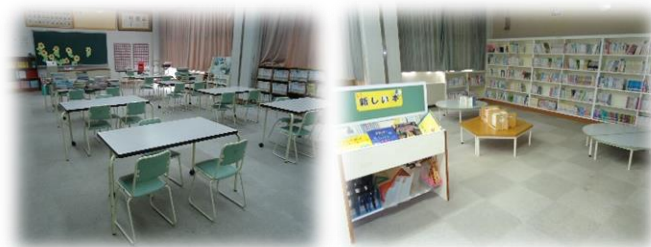
<机といすを使って読書>

夏休み前には、子どもたちにもお手伝いをしてもらいながら、夏休み中の子どもたちへの図書貸し出しもストップして、休みの間に、学校の全職員で図書室の環境整備に取り組みました。少しでも学校図書の実用性を高めるために、図書室の利用をしやすいようにと、みんなで考えながら、図書室を少しでも明るくきれいにするために頑張りました。そして子どもたちの大切な「本との出会い」を応援していきます。