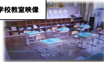
港小学校教室映像

港小学校校舎（現港東小学校校舎）内の映像を子どもたちが見て、港小学校で学校生活を送る見通しを持ちました。