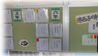
作品は職員室前廊下の壁に掲示