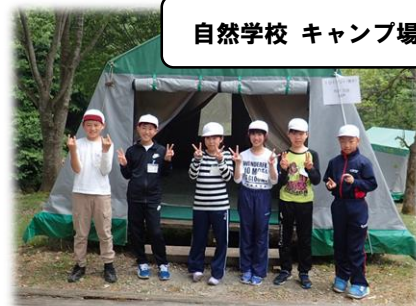
自然学校 キャンプ場にて

責任が重い分、やりがいがあり、終わった後の学びも大きくなります。がんばってください。