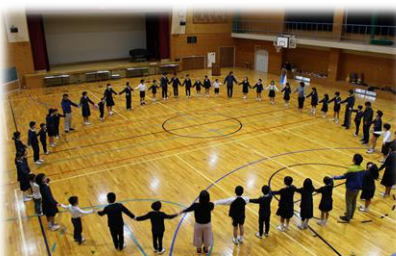
全校児童と先生で大きな輪

4月26日(金)平成最後の授業日に、行いました。6年生が中心になり、8名の1年生をお世話しながら、温かい時間を過ごせました。最後には全児童教員で輪を作り、こころを一つにしました。