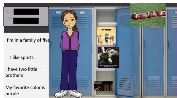
Summit School より届いた自己紹介カードより