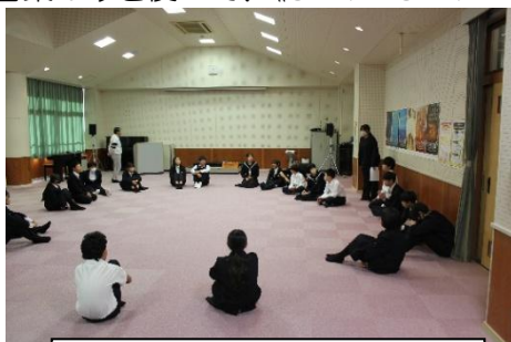
バースデーラインとペアづくり

次に、ペアごとにクリスマスに誰かがおもっていることをテーマに「オリジナル短歌づくり」に取り組みました。白紙と新聞紙の切れ端(新聞片面の8分の1程度)が配布され、新聞紙に書かれている言葉のみを使って、《5・7・5・7・7》の短歌を作成しました。