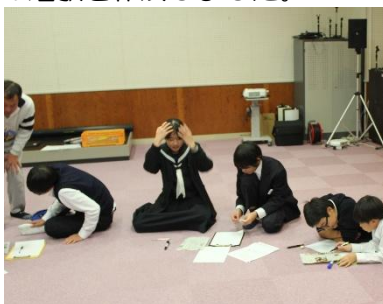
オリジナル短歌づくり