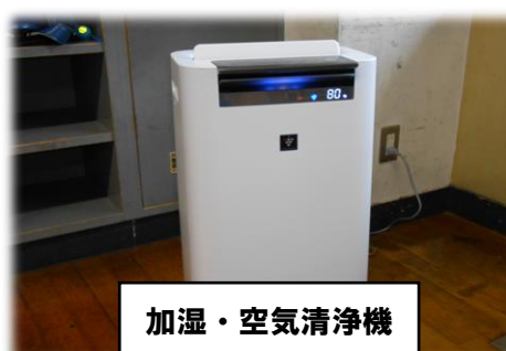
加湿・空気清浄機