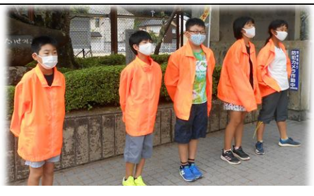
児童会本部の朝の挨拶運動

9月末で、前期の児童会が終わります。4月から週3日間ずっと続けていた、児童会本部の挨拶運動。やりきりました。