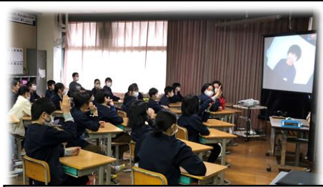
「6年生クイズ」を楽しむ6年生