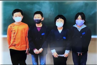
ビデオメッセージ（3年生）