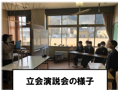
立会演説会の様子