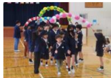
昨年度 新入生歓迎会より

本年度も、こども園等と小学校との従来からの連携をよりよく進めて参ります。特に、「幼児期の終わりまでに育ててほしい10の姿」を意識しながら、その力を小学校でもさらに伸ばしていきます。あわせて、目に見えにくい力（非認知能力 やり抜く力・自制心・協働性等）も大切に育てていきたいと思います。保護者・地域・学校が同じ方向を向いて、子どもたちの成長を支えていきたいと考えています。今後ともご協力をお願いいたします。