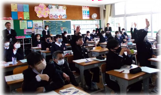
←元気に発表しています！(数学(5月12日授業参観にて))