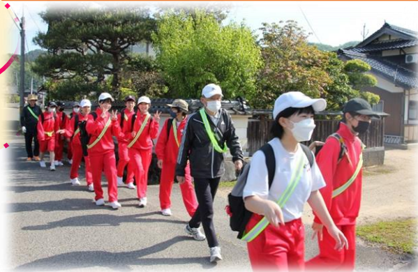
5月2日(火) 校外学習で中田工芸岩中工場まで歩きました↑

5月12日(金)、各小学校の校長、旧6年生担任と養護教諭が中学校1年生の授業(数学)を参観しました。その後、入学してから約1か月経った生徒たちの様子について情報交換を行いました。