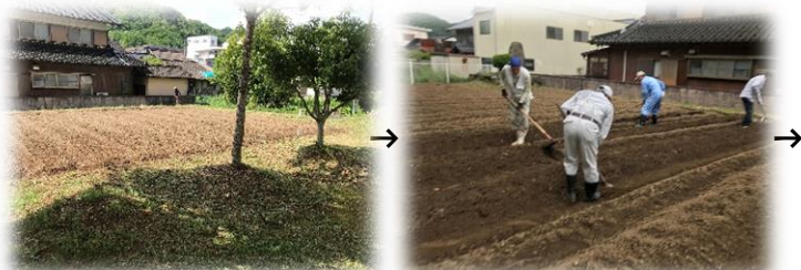
畑の草取り・耕耘 畝づくり・マルチかぶせ