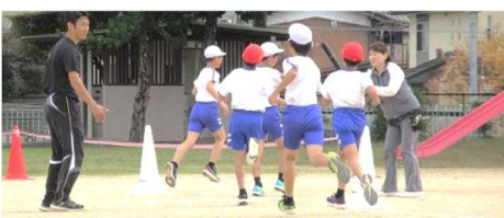
(6)「ゴ〜〜〜ル」(日高小運動場)