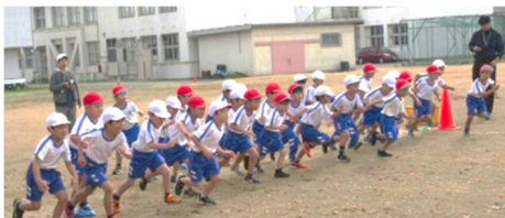
(1)スタートは日高高校