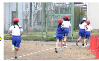
(3)グラウンドを後に…