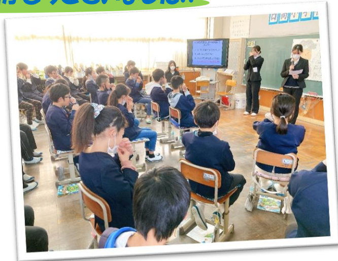
↑ 日高高校看護科専攻生による保健指導(6年)

◇25日から子どもたちは冬休みに入ります。クリスマスや大晦日、お正月など子どもたちが楽しみにしている行事も多く、家族そろって過ごす時間が増える時期でもあります。ぜひ、ご家族で共に過ごす時間を大切にいただければと思います。あわせて、冬休みは、年末の大掃除やお正月の準備など、大変忙しい時期でもあります。子どもたちにも役割を与えて「家族の一員」としての自覚や責任を持たせていただければ幸いです。