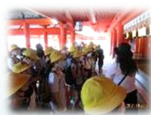
世界遺産「厳島神社」ガイドさんのお話も真剣に聞けました