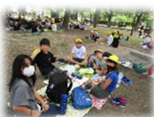
平和公園でのお弁当タイム。中には家族からのメッセージが…