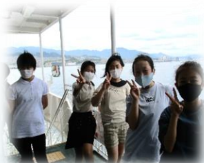
フェリーで宮島へ 短い時間でしたが、みんな大はしゃぎ