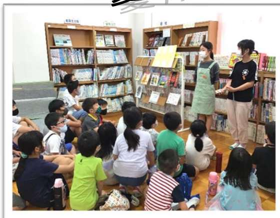
～スーパーわくわく活動・計画委員会によるクイズコーナー～

7月12日には、「スーパーわくわく活動」と名付けて、縦割り班で七夕飾り作りと校内ウォークラリーを行いました。行事が減った中、短い時間でしたが、高学年の上手なリードで楽しい時間を過ごすことができました。