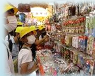
お楽しみ、お土産タイム。どれにしようかな？ん～、迷います…