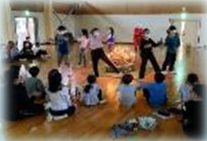
雨でキャンドルファイヤーとなりましたが、楽しいひと時に！