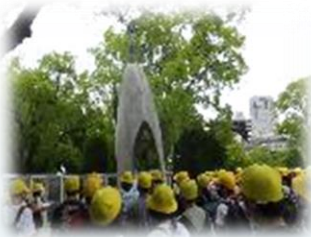
平和公園でのセレモニー。平和を願う歌声が公園内に響きました！