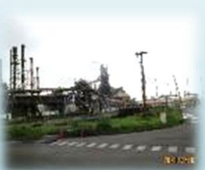
JFE スチール工場見学。工場のスケールの大きさにびっくり！