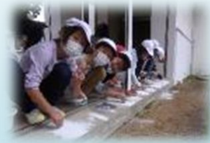
3日目の石のペンダント作り…みんな黙々と石を削りました