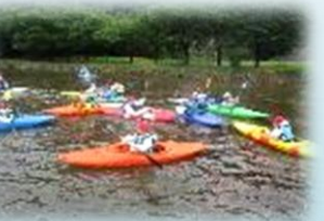
円山川公苑でのカヌー・カヤック体験。笑顔が弾けました

雨続きの自然学校となりましたが、なんとか無事に終わることができました。保護者の皆様には、準備、送迎等大変お世話になりました。ありがとうございます