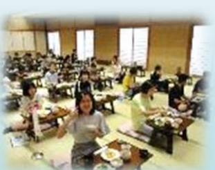
ホテルでの夕食。感染症対策で静かに「いただきます！」