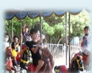
鷲羽山ハイランドでも楽しい時間が過ごせました