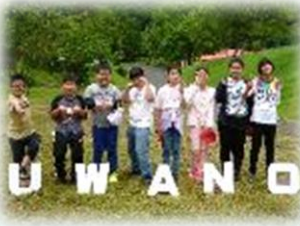
兔和野高原到着！これからの活動にドキドキ・ワクワク！！