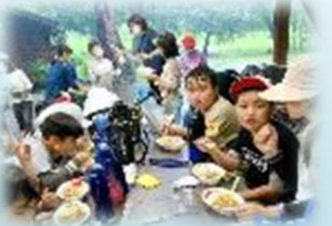
雨の中でしたが、各班ともおいしいカレーができました！