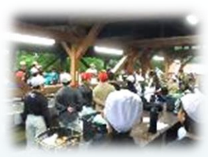
一日の活動の後の夕食は最高。毎食、おいしく頂きました