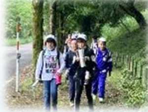
ウォークラリー。班で協力してチェックポイントを探しました