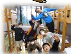
部屋での様子です！二段ベッドでの生活が新鮮でした