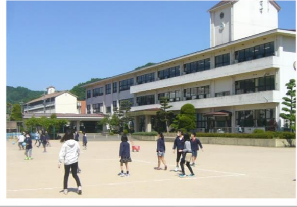
久しぶりに歓声が響いた運動場

一方、生活アンケート「心と体の健康チェックシート」の結果からは、「いらいらしたり、かっとしたりすることが増えた」「なかなか眠れない」など、生活リズムの乱れからくる不安やストレスを感じている実態も明らかになりました。登校可能日には、市から心理士さんの派遣をお願いし、子どもたちの様子の観察と、必要な場合はカウンセリングを受けることも計画しています。