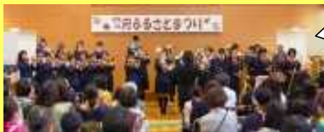
金管バンド出演 (国府コミュニティセンター)

金管バンドは11月25日(土)にバンドフェスティバル(朝来市ジュピターホール)に出演します。